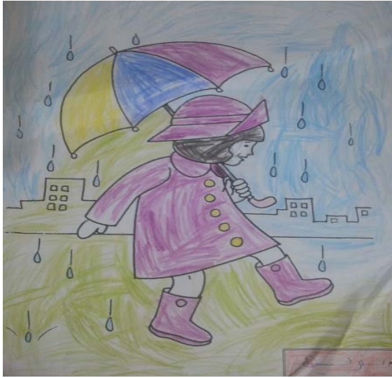
نزيه حسان الكردي - 4 سنوات

المشاركات في هذا العدد لأبناء الأستاذ / حسان الكردي ، عمار 3 سنوات وأربعة شهور – نزيه 4 سنوات وثمانية شهور ، نسأل الله أن يبارك له فيهما وأن يحفظهما وينفع بهما الأمة الاسلامية :